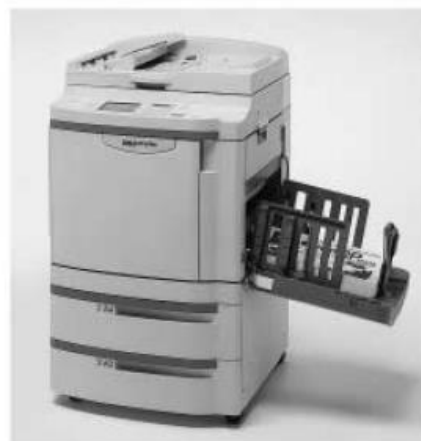
数码打印机“平版印刷”

本公司从平成 2 年 (1990 年)，在专用“平版印刷”的“理想用纸”系列品中增加了再生纸产品。平成 10 年 (1998 年) 3 月出售了新产品“理想环境用纸 100”“理想环境用纸 70”，其废纸使用比率分别为 100%、70%，白色度均是 70%，是考虑到环保的绿色印刷用纸。另外平成 14 年 (2002 年) 3 月，在“理想环境用纸 100”系列中还增加了彩色用纸。