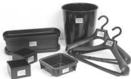
变成衣架或花盆等生活所需的再生日常用品。

对用完了的“平版印刷”墨盒主要进行材料再生。墨盒在粒化厂被加工为细小的树脂颗粒之后，在成形厂加工成各种形状的成形产品。目前本公司利用这种颗粒来制造衣架、小容器、花盆等。另外，墨盒的一部分用于焚烧再利用。墨盒与装垃圾的口袋或超级市场的包装口袋一样，是由聚烯烃树脂做成的，可以用作为燃料。焚烧后留下的灰可以用于路基材料来有效利用。