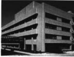
有机·无机·表面分析研究室