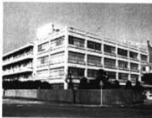
机能性材料分析研究室