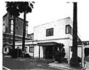
医农药分析研究室