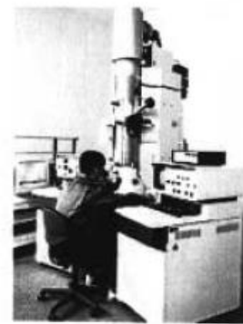
超高分解能透过电子显微镜