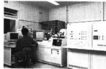
高分解液体色谱质谱联仪