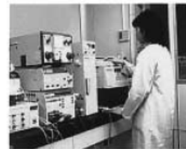
액체 크로마토그래피 질량분석계