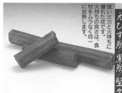
えびす炭 黒炭 堅ク