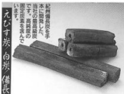
えびす炭 白炭 備長