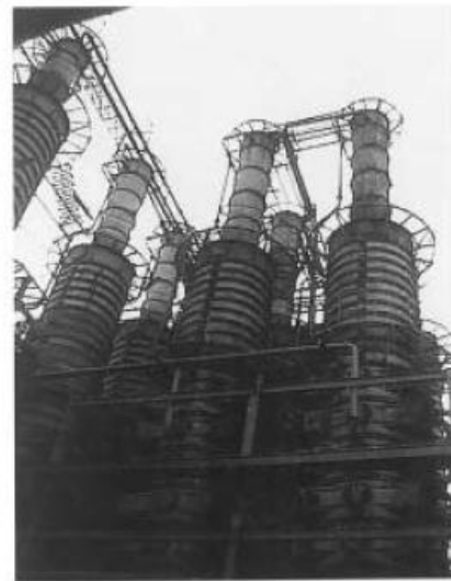
二氧化碳(碳酸气)吸收塔