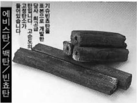
에비스탄 / 백탄 / 빈쵸탄