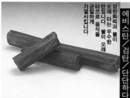
에비스탄 / 검탄 / 단단하다