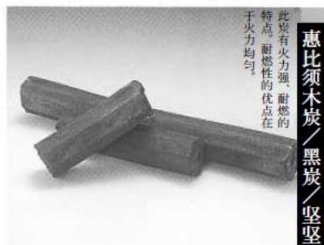
惠比须木炭 / 黑炭 / 坚坚