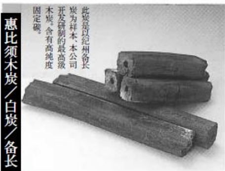
惠比须木炭 / 白炭 / 备长