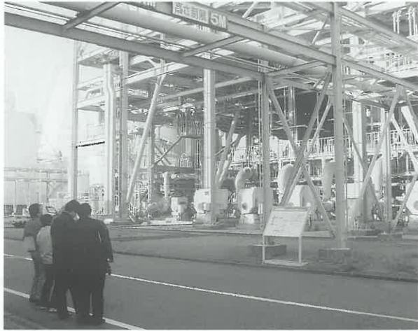
中国電力(株)新小野田火力発電所で 脱硫、脱硝、コットレル等の 排ガス処理設備を見学