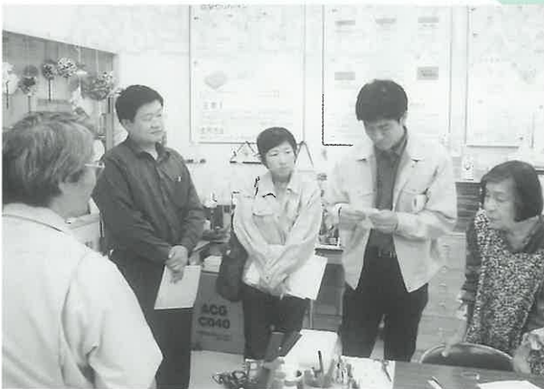
宇部市リサイクルプラザで宇部市の廃棄物・ リサイクル対策を習得