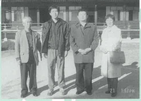
交流ボランティアと 防府毛利邸の日本庭園を見学