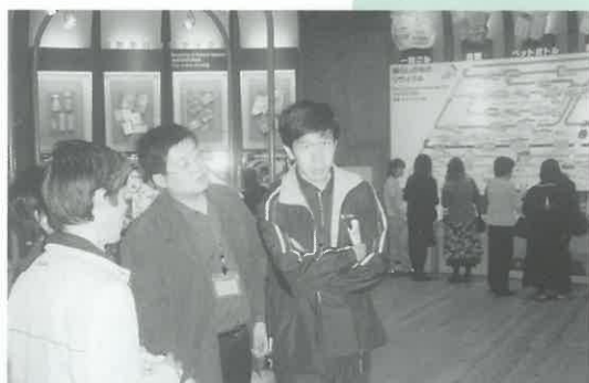
市民の環境学習を支援するための施設である 北九州市環境ミュージアムを見学