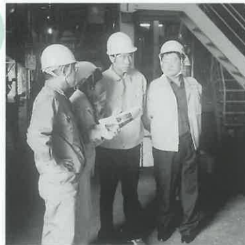
(株)EUPで廃プラスチックの 再資源化設備を見学