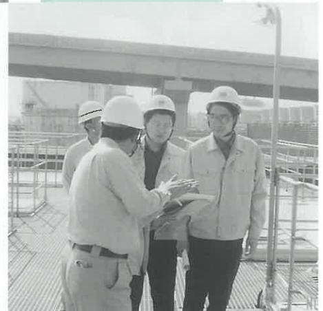
協和発酵(株)で廃水処理施設を見学