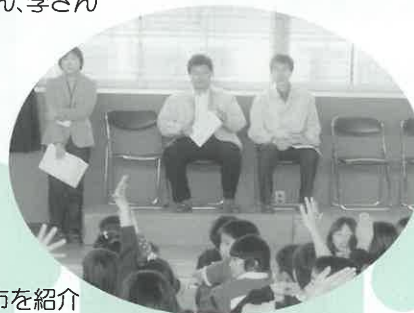
3年生児童に威海市を紹介