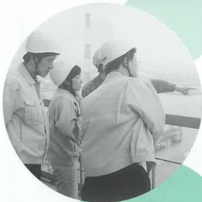
宇部興産(株) 宇部セメント工場で セメントキルンによる 資源リサイクル設備を見学