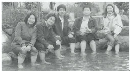
湯田温泉の足湯で疲れを癒す