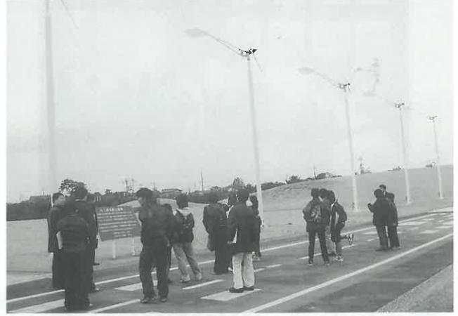
山口宇部空港の風力発電設備を見学