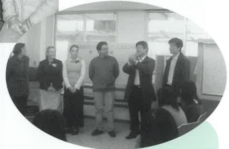
「英語でしゃべろうの会」で 国際交流