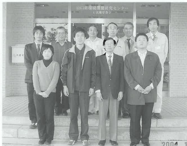
山口県環境保健研究センターで水質汚濁、大気汚染対策を実習