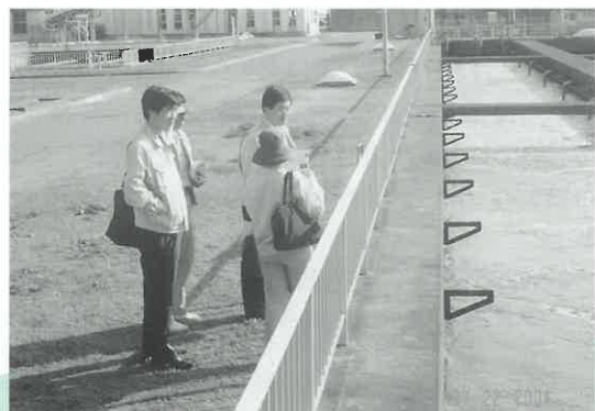
宇部市下水道東部浄化センターで下水処理設備を見学