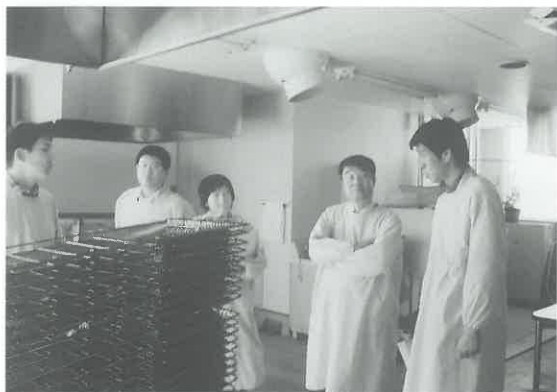
山口大学医学部で医療現場における 医療廃棄物処理について習得