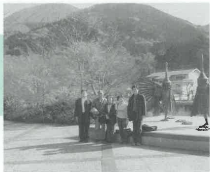
交流ボランティアと 津和野の秋を訪ねて散策