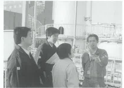
中国電力(株)新小野田火力発電所で 廃水処理設備を見学