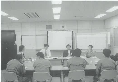
(株)PETで火力発電所の環境対策を習得