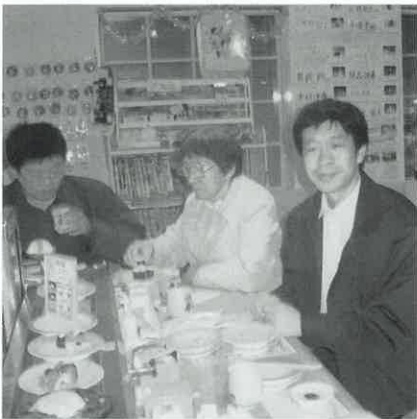
回転寿司の味を体験