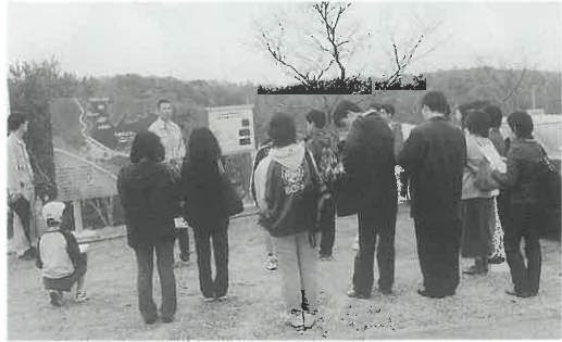
宇部丸山ダムの太陽光発電設備を見学