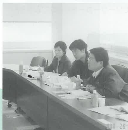
千葉市でGIS(地理情報システム)を応用した 環境保全対策について習得