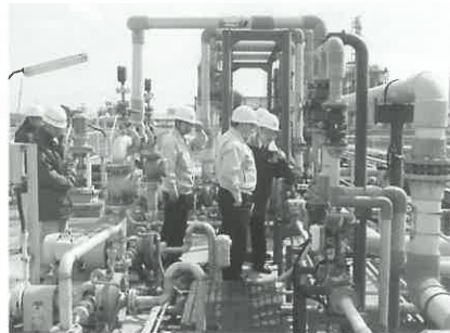
協和発酵工業(株)で廃水処理施設を見学