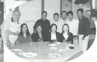
ペルー元研修生、ペルー山口県人協会、ツアー参加者の三者交流が実現