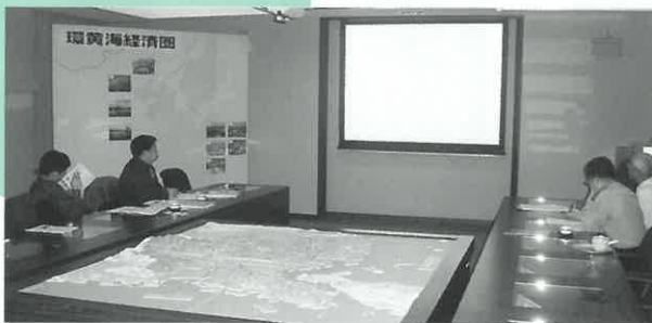
北九州市の環境政策を習得