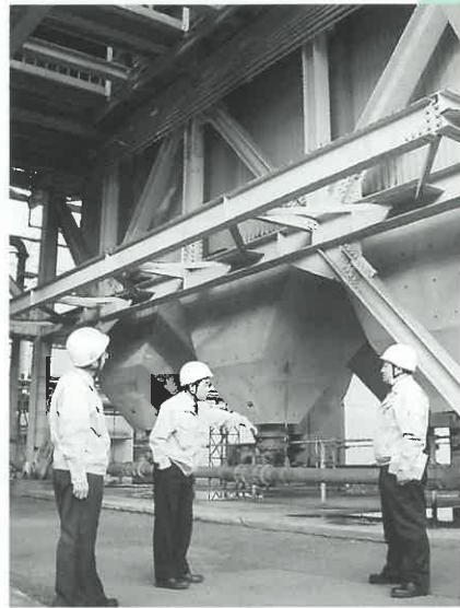
中国電力(株)火力発電所で脱硫、脱硝、コットレル等の排ガス処理設備を見学