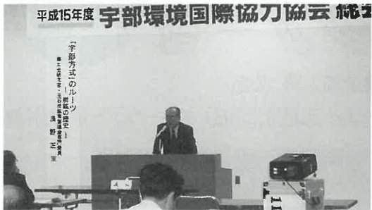
平成15年度 宇部環境国際協力協会 総会 6月13日(金)に開催し、事業計画が審議されました。