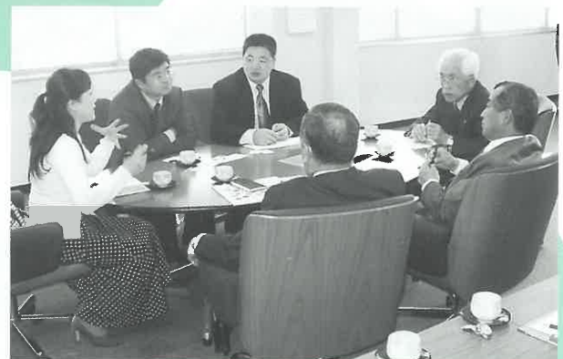
宇部商工会議所では中国の問題点について説明し、環境技術 を持つ市内企業と威海市間でのビジネスチャンスを検討