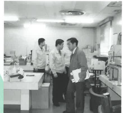
山口県環境保健研究センターで 大気汚染対策を実習