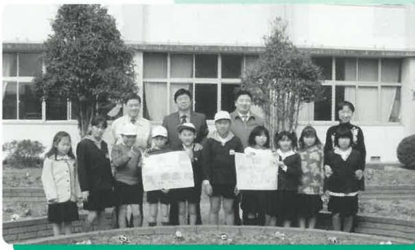
「寄せ書き」をプレゼントする4年生児童と一緒に