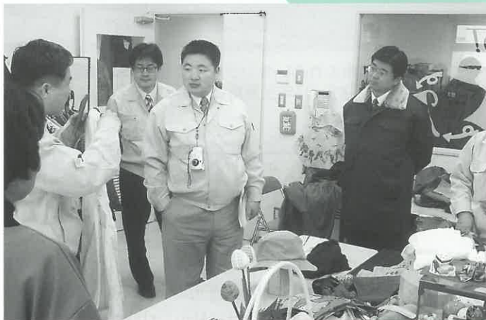
宇部市リサイクルプラザで宇部市の廃棄物・リサイクル対策を習得