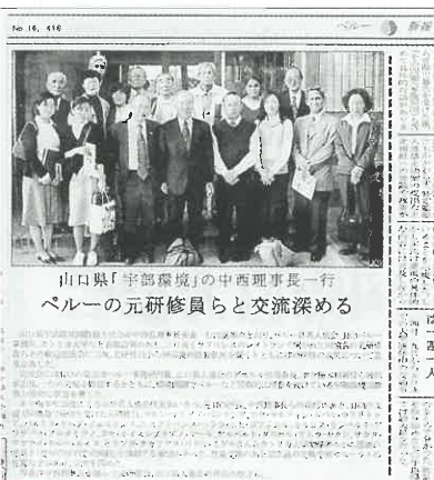
当協会の「ペルーツアー」が掲載された「Peru Shimpo」紙