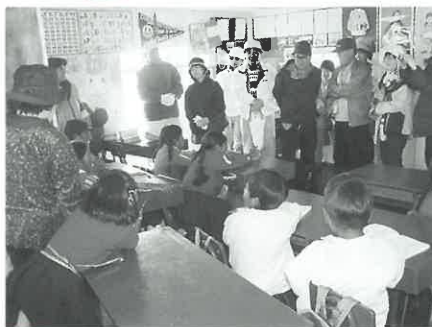
子チカカ湖の浮島(ウロス島)では小学校の授業参観後記念品を交換