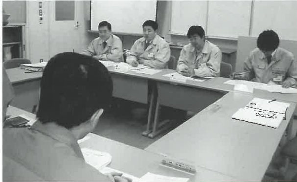
(株)PETで火力発電所の環境対策を習得