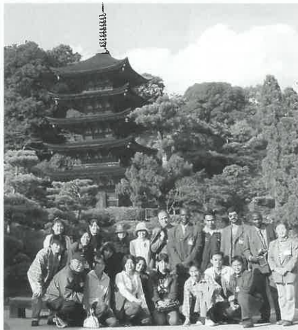
(株)PETで最新の火力発電技術を研修中の6カ国8名の研修生と当協会国際交流ボランティアがバスで秋芳洞や山口市内を自然、歴史探訪し交流しました。