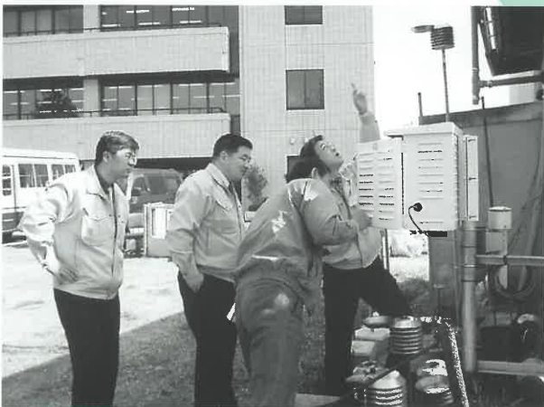
周南市大気汚染自動測定局を見学