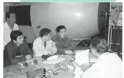
北九州市環境ミュージアムで発電機の実験