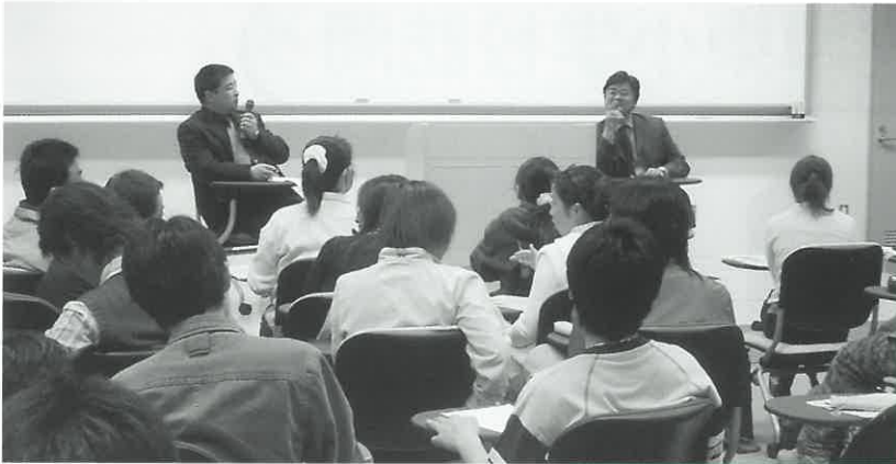
宇部フロンティア大学で留学生と就職や威海市政府の採用状況等について懇談