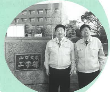
山大工学部正門前で