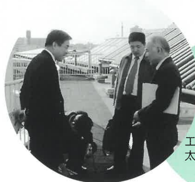
東京都板橋区 エコポリスセンターで 太陽電池パネルを見学