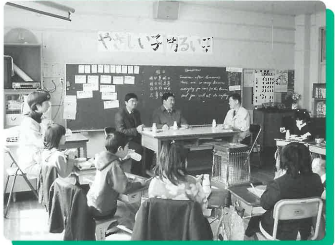
「味はいかがですか。」 3年生児童と学校給食を試食