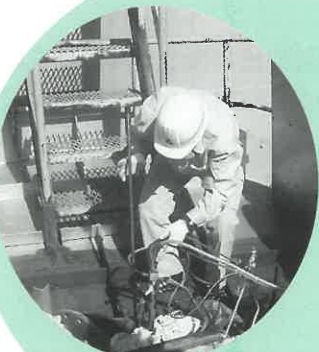
煙道ばいじんの測定実習 (宇部興産(株)ケミカル工場)