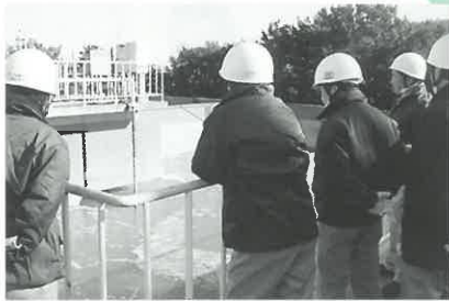
中国電力(株)火力発電所で 廃水処理設備を見学