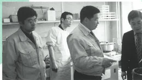
山口大学医学部で医療現場における 医療廃棄物処理について見学