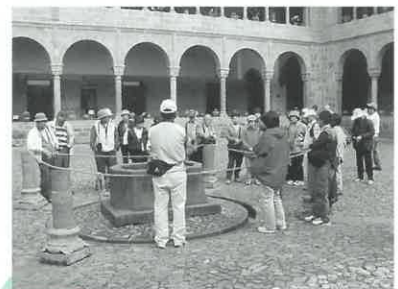
クスコのコリカンチャ遺跡を見学