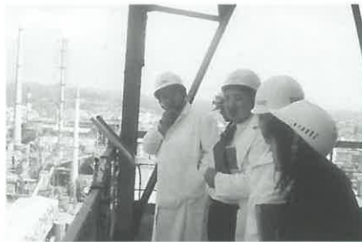
宇部興産(株)宇部セメント 工場の資源リサイクルセン ターで廃棄物処理設備とし てのNSPセメントキルンを見学