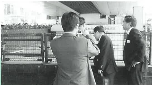
東京都板橋区大和町交差点にて 土壌による大気浄化施設を見学