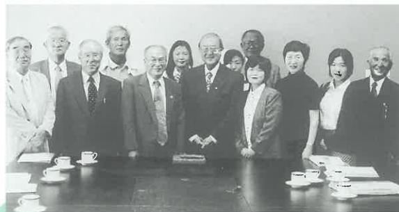
JICAペルー事務所を表敬訪問し、今後の協力関係を約束した。