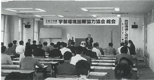
5月31日に総会が行われました。