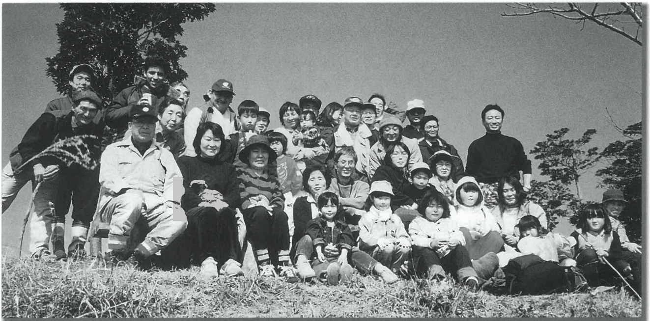
(小野ふれあいセンター主催 平原岳登山の行事に参加し、市民と交流)