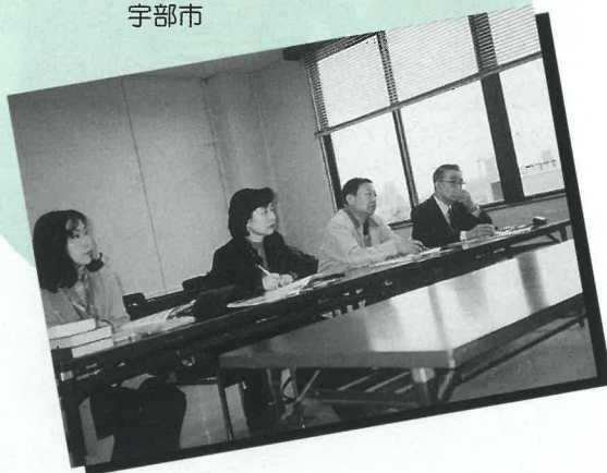
大連市環境モニタリングコース研修 研修主体:KITA((財)北九州国際技術協力協会) 期間:平成13年2月13日(1日間) 研修生:大連市環境保護局監測科研处处長、 同科学技術委員会国際合作处处長2名 研修視察先:宇部興産(株)、同セメント工場、 宇部市