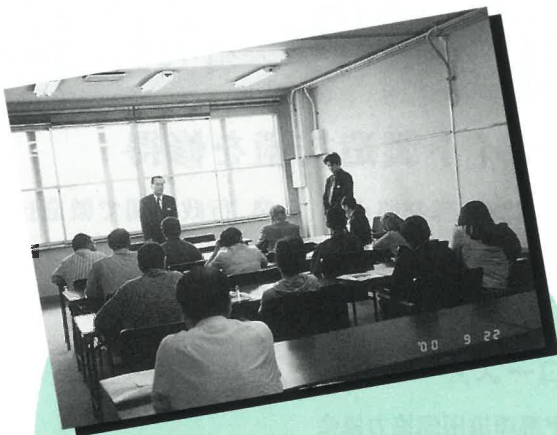
平成12年度集団研修