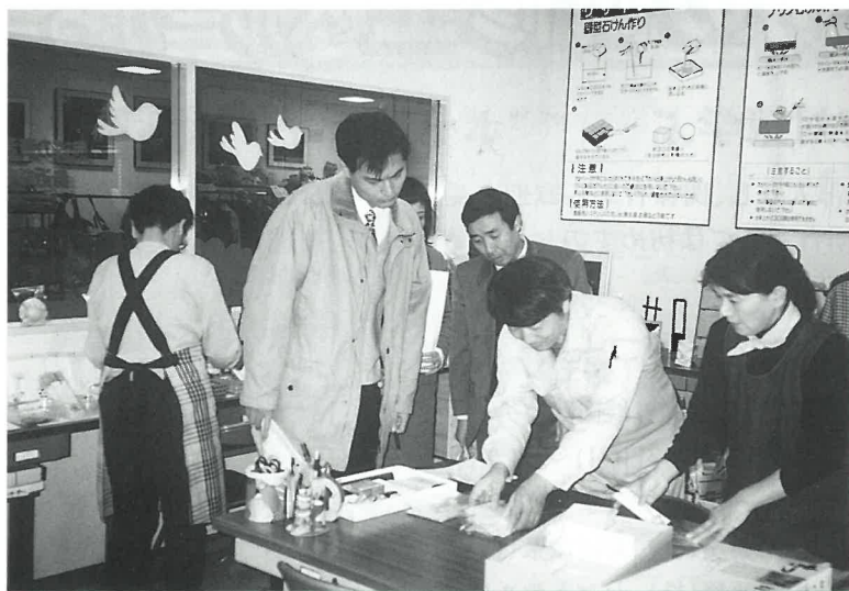
'99.12.14 大連市個別研修コース 「環境保全見学」1名 宇部市リサイクルプラザ